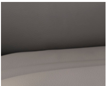
+ Ambiance intérieure Collin (cuir) ○