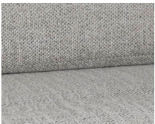
+ Ambiance intérieure : Samir