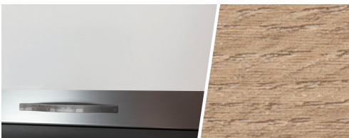
+ Mobilier décor : Amberes Oak